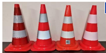
R2A R1B R1B R0

50 cm, 2.3 kg, R2A: CHF 70.- 50 cm, 1.9 kg, R1B: CHF 50.- 50 cm, 0.6 kg, R1B: CHF 35.- 50 cm, 1.7 kg, R0: CHF 30.- Signal- / Lampenhalter: 35.-