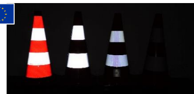
R2A R1B R1B R0